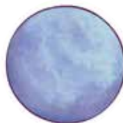
PO Planeta atitudinii pozitive