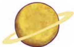
PONTO Planeta empatiei