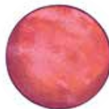
OKONAU Planeta proactivității