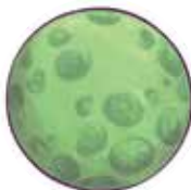
HERZ Planeta stimei de sine