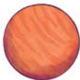
LIBRA Planeta asertivității