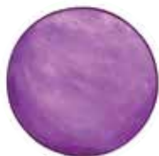
ALFA Planeta încrederii